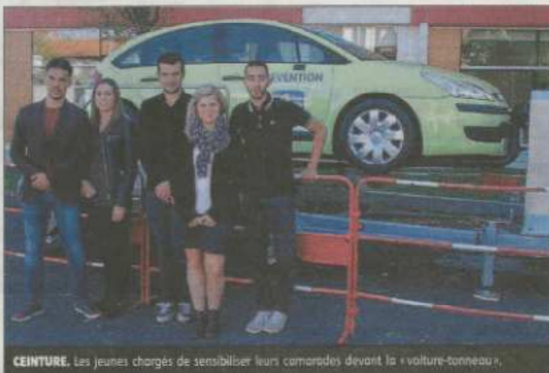
CEINTURE. Les jeunes chargés de sensibiliser leurs camarades devant la «voiture-tonneau».

Régulièrement la chambre régionale agent général d'assurance participe activement à la formation des étudiants sous forme de conférences professionnelles, de soutiens financiers (prix remis aux étudiants lors des concours organisés par l'équi-