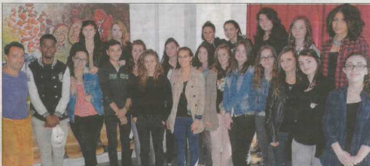
SAISIR L'IMPLICATION D'UN ARTISTE. Les élèves de 1 er L ont dialogué avec Jean-Thibaut Fouletier pour comprendre son approche.

Les élèves de première littéraire du lycée Ambroise-Brugière ont récemment rencontré Jean-Thibaut Fouletier qui est venu leur présenter le diptyque « Au revoir les enfants ».